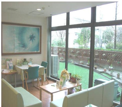
やすらぎサロンの様子